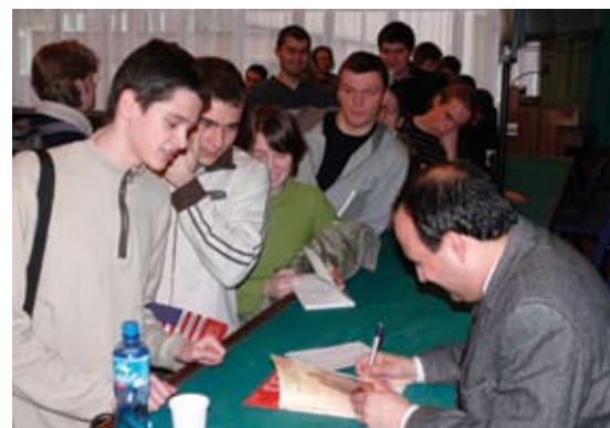
Po każdym spotkaniu widok był identyczny – długa kolejka po autograf profesora Woodsa.