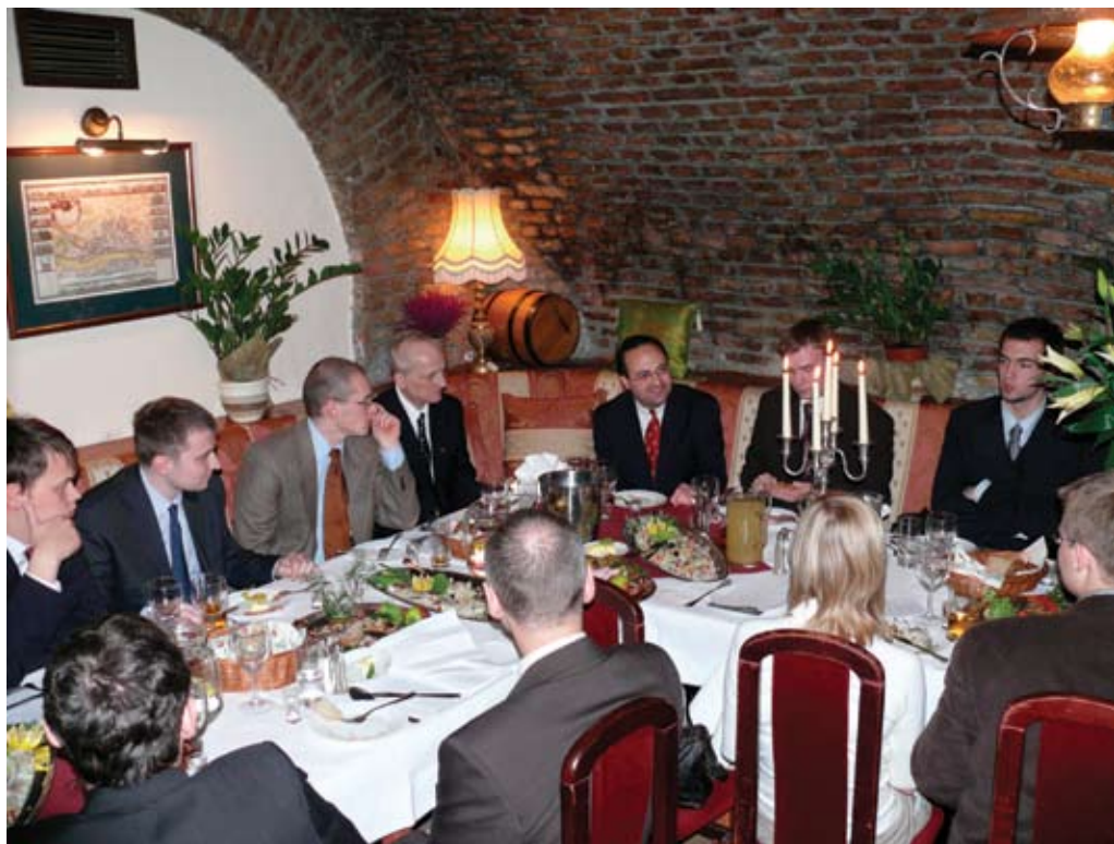
Uroczysta kolacja z udziałem niemal trzydziestu osób odbyła się w warszawskiej restauracji „Literatka”.