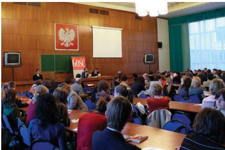
W Poznaniu wykład przyciągnął rekordową liczbę słuchaczy – niemal 150 uczniów i studentów.